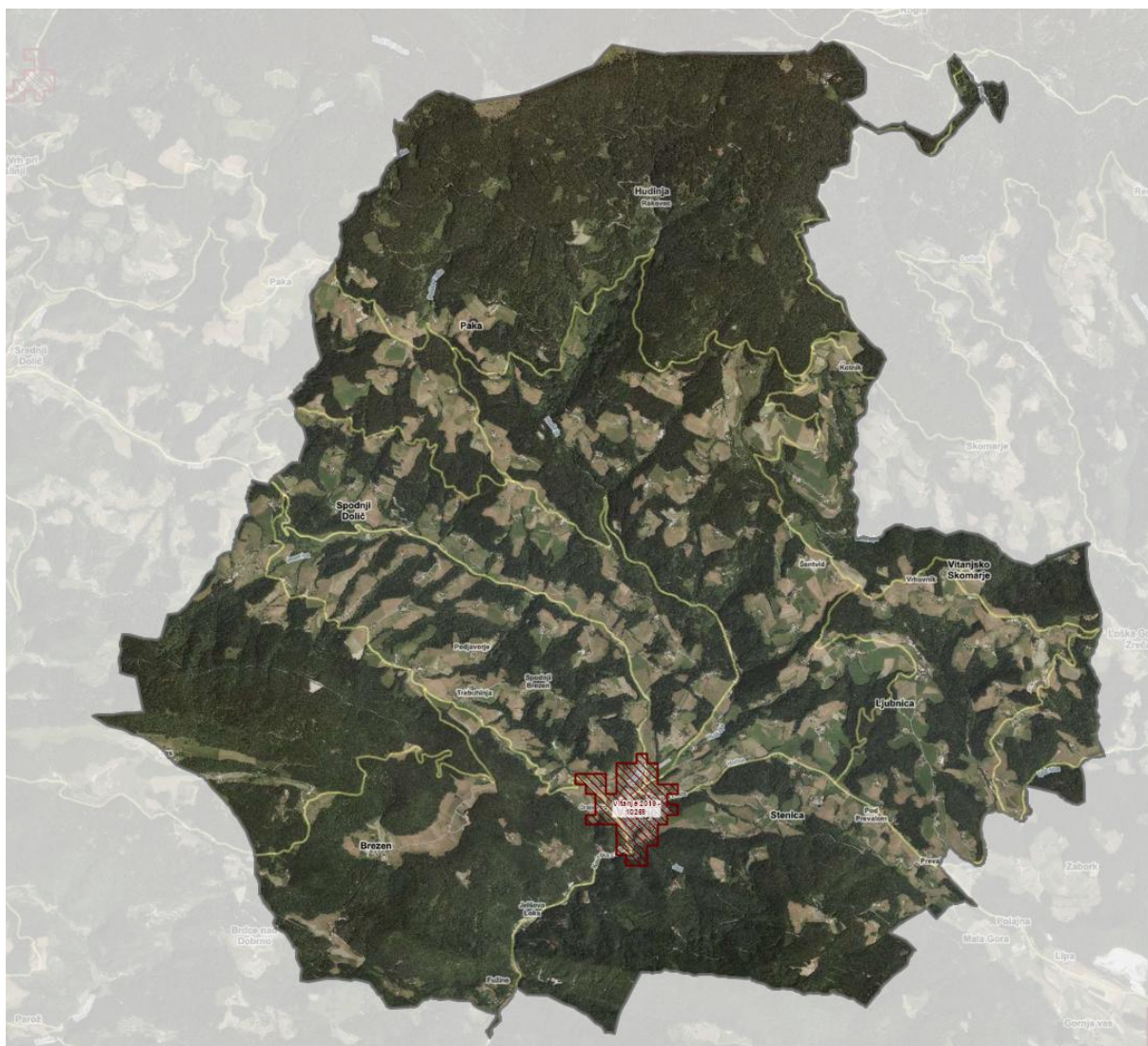
Prikaz aglomeracij v občini Vitanje.