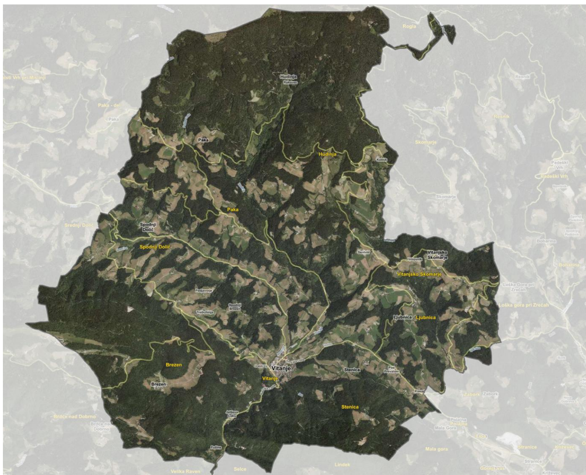
Prikaz naselij v občini Vitanje.