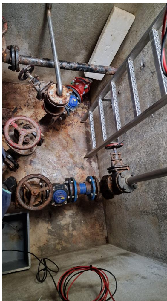
Slika 4: Amatorsna celica v vodohranu Kladnik