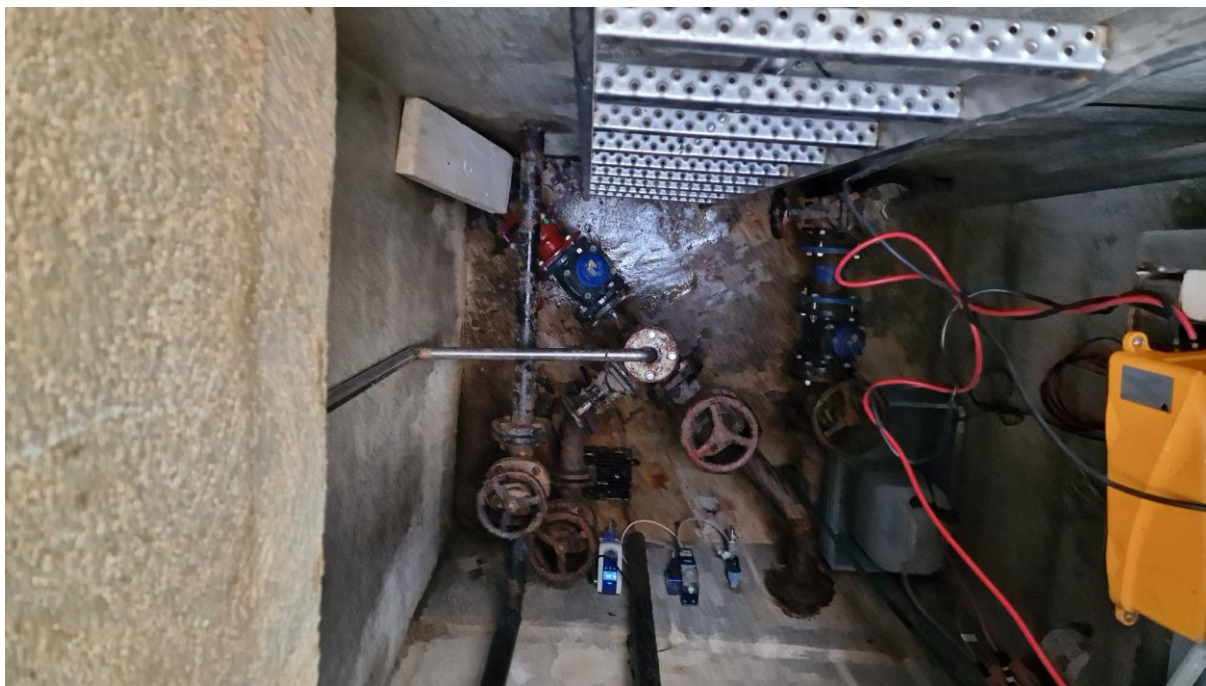
Slika 3: Amatorsna celica v vodohranu Kladnik