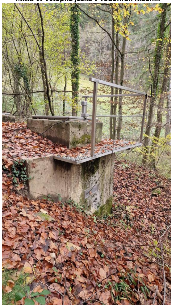
Slika 2: Vstopna podest in ograja na vodohranu Kladnik