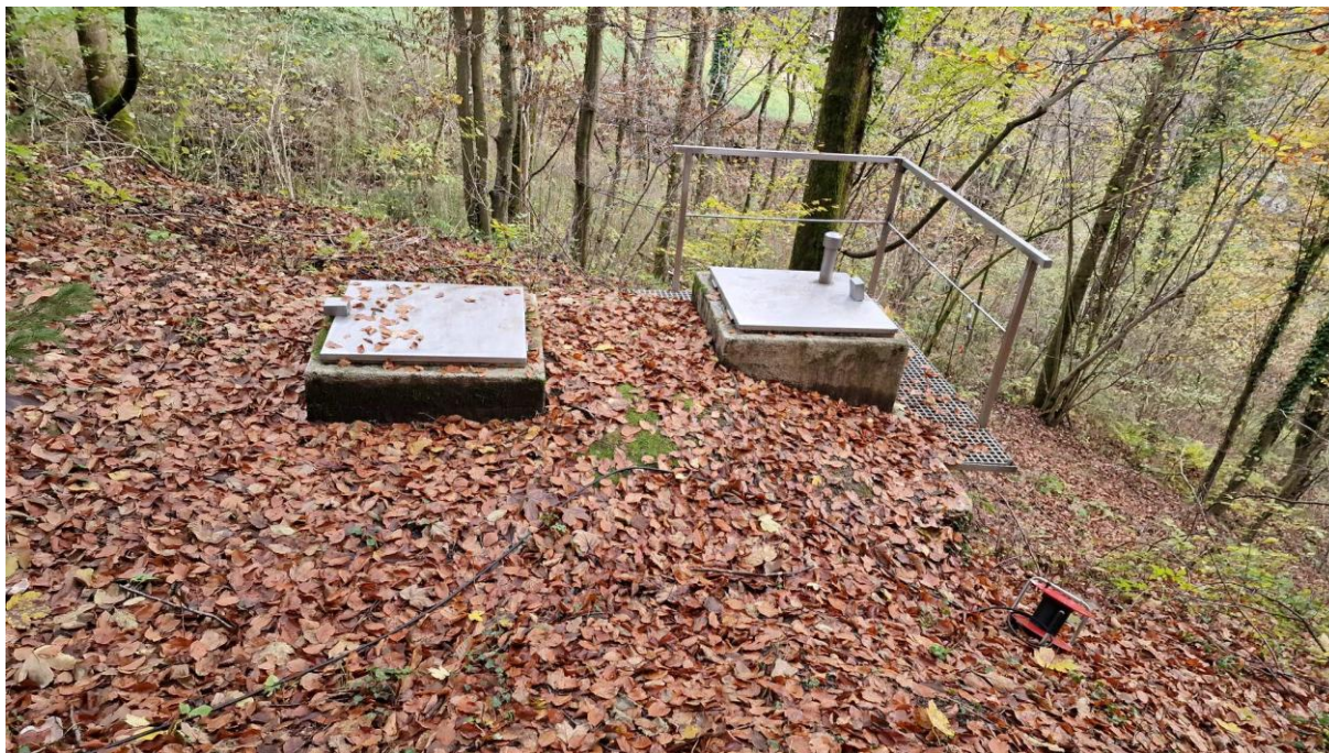
Slika 1: Vstopna jaška v vodohran Kladnik