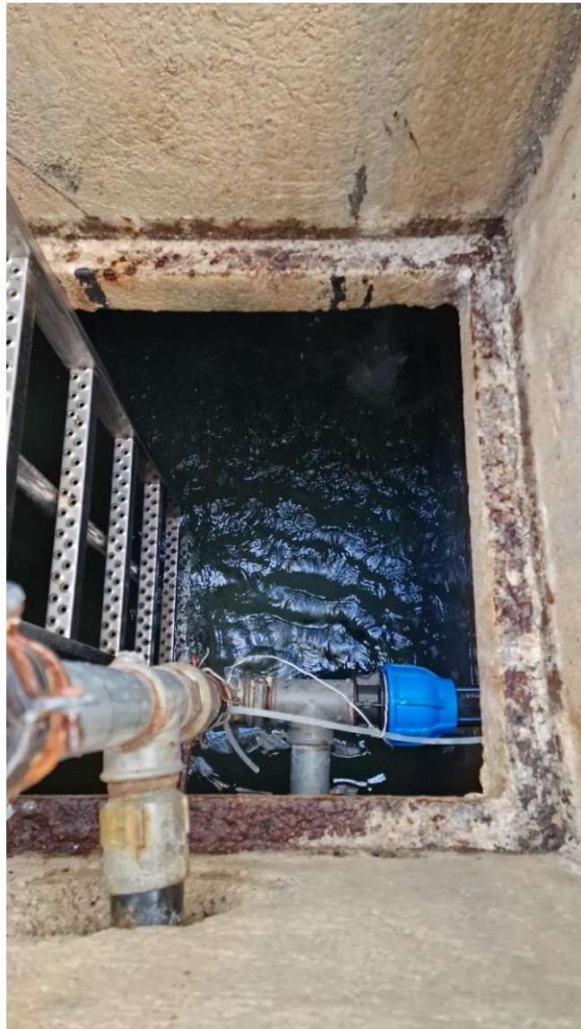
Slika 5: Vodna celica v vodohranu Kladnik