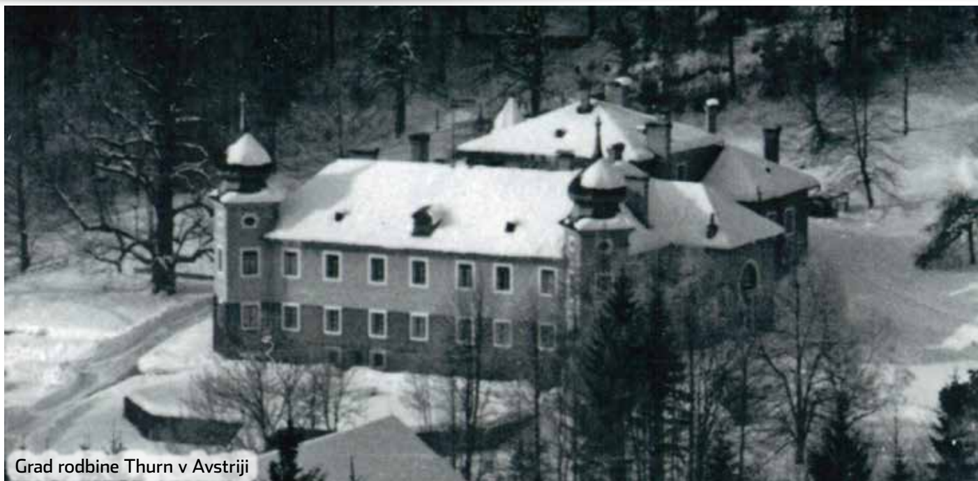
Grad rodbine Thurn v Avstriji

zmetali v vzdolžne vrsta bolj po sredini in v času požiga poklicali, običajno spomladi ob lepem vremenu, vse interesente za brezplačen najem zemljišča, ko so požigali. Na enem takšnem požiganje okoli leta 1948 sem kot otrok sodeloval tudi jaz. Že dva ali tri dni pred tem so povabili vse, da pridejo na požiganje. Bilo je sicer po vojni, vendar še na isti način, kot prej. Frata je bila na Paki, tako smo šli na Rutnika, mimo Mlinšeka in Urbana in malo navzdol na frato. Večina je imela s seboj kakšno orodje, zaradi varovanja, da se ogenj v primeru vetra ne bi razširil. Kdor je bil brez orodja, pa je dobil v roke svežo smrekovo vejo. Gozdni delavci so pričeli požig na vrhu in ogenj nato postopoma podtikali navzdol. Suhe veje so razmeroma hitro pogorele. Nato so logarji izmerili posamezne parcele, ki so jih dodelili ljudem in jih zakoličili z že prej pripravljenimi količki in jih označili, komu in katero parcelo so podelili, pa so si