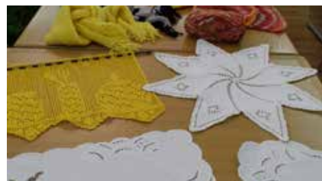
Še nekaj različnih izdelkov (2).

~ 10 udeleženk, ki tečaj obiskujejo že četrto leto,