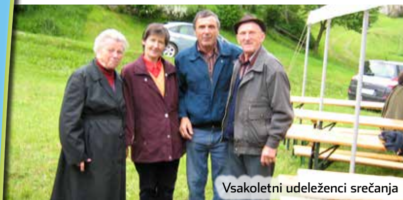
Vsakoletni udeleženci srečanja