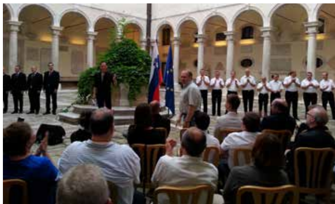
Predstavitve kozmonavta na odprtju