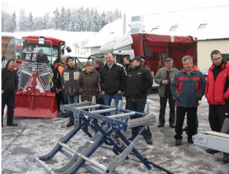
DEMONSTRACIJA GOZ. MEHANIZACIJE VITANJE