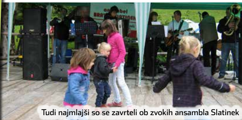
Tudi najmlajši so se zavrteli ob zvokih ansambla Slatinek