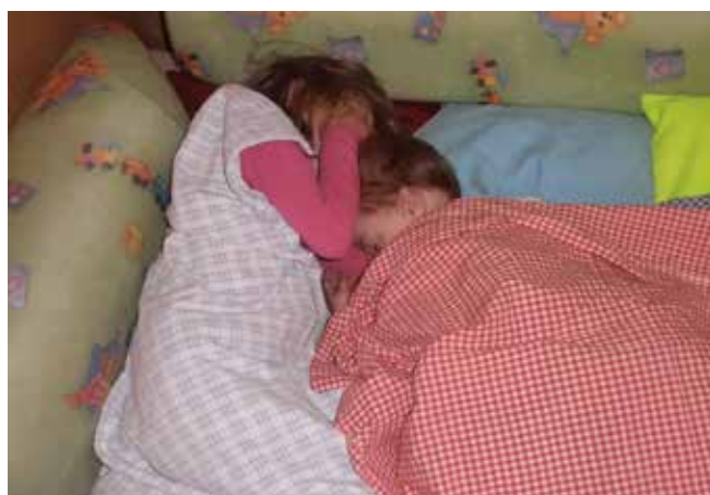
Otroci pri nadaljevanju spanja ob 5.15h (zjutraj)