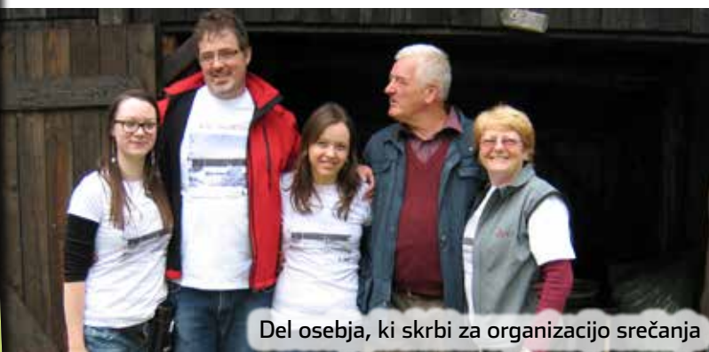
Del osebja, ki skrbi za organizacijo srečanja