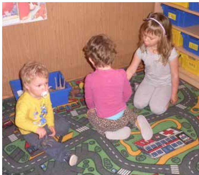
Otroci pri igri