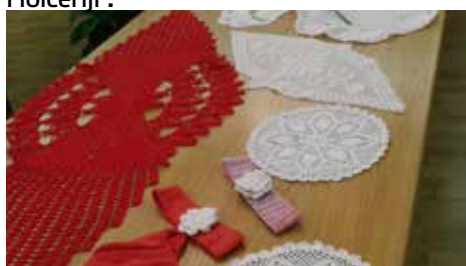
Različni izdelki (2).