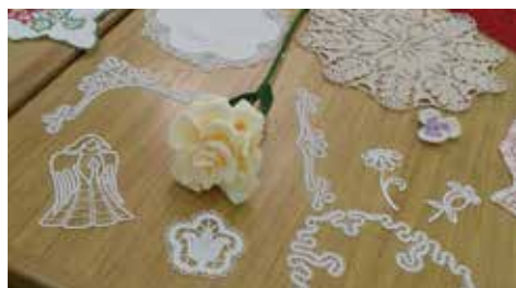
Tudi klekljani izdelki (2).