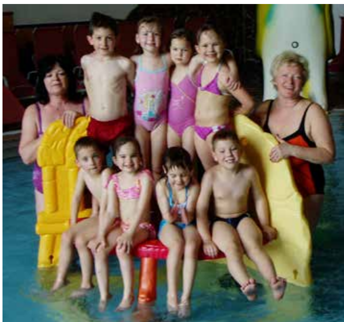
Ob koncu so bili z vodo dobri prijatelji.

Zadnji dan so jih prišli gledat tudi starši in marsikdo od njih ni mogel verjeti, kaj vse se lahko naučijo otroci v tako kratkem času. Učiteljici sta se staršem tudi zahvalili za zaupanje. E. N.