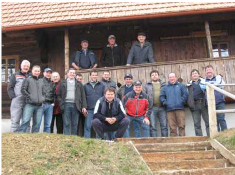
ČLANI SK NA OGLEDU BEŠKOVNIKOVE KAŠČE