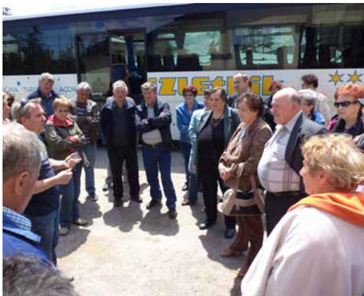
Upokojenci so pozorno poslušali lastnika grada Prestranek.