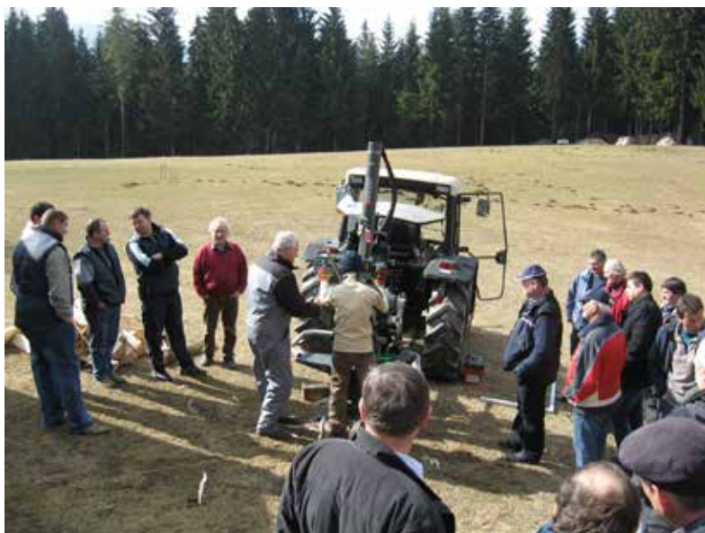
DEMONSTRACIJA CEPILCA DRV 15.3 (14)