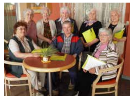
Skupina bistre glave.