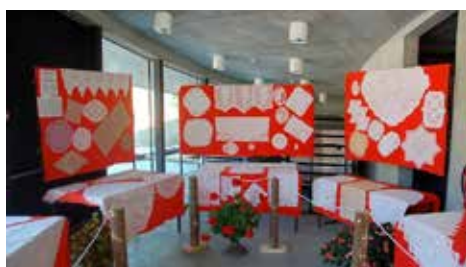
Izdelki udeleženk tečaja na razstavi na Holceriji .