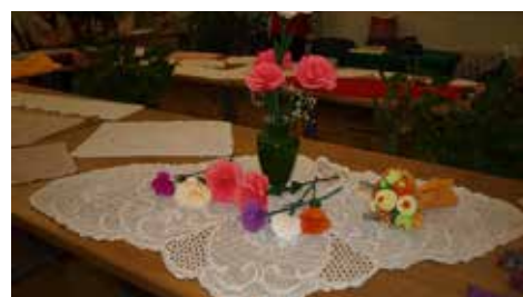
Kvačkan prt z ročno izdelanim cvetjem.