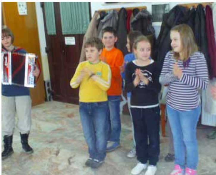
Vnuki zapeli babicam in mamicam.