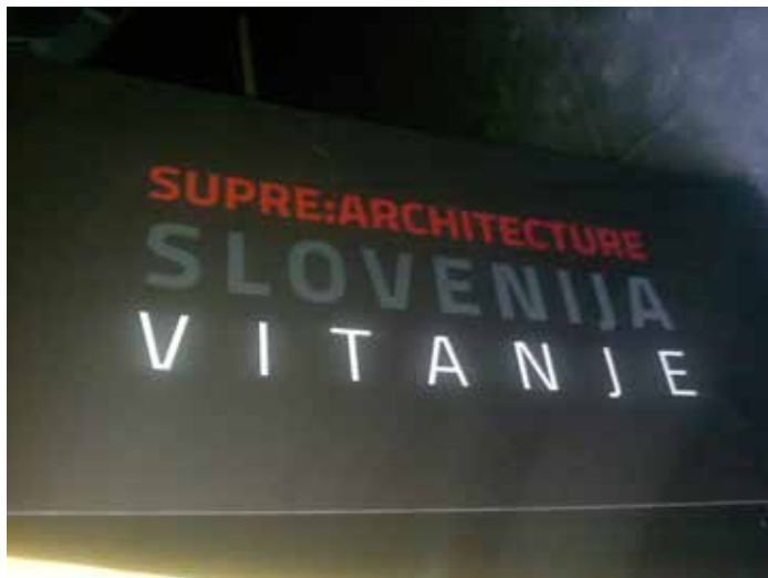
Vhod v slovenski razstavni prostor