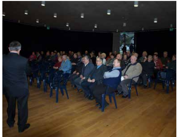
Člani DU Vitanje na občnem zboru.