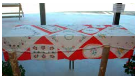
Izdelki naših babic na razstavi na Holceriji.